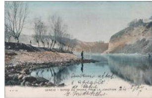
Genève, bords du Rhône près de la Jonction Atar S.A. (Atar Roto Presse SA)