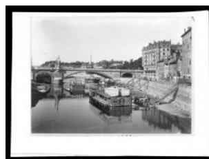
Genève, Rhône: bras droit du fleuve en aval des ponts de l'Île Auteur inconnu 2e moitié 20e s.