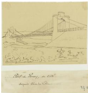
Aire-la-Ville, pont de Peney Louis George milieu 19e s.