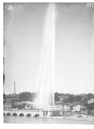
Genève, Coulouvrenière: jet d'eau 1886-1891