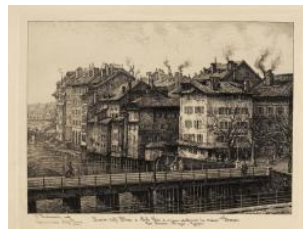
Genève, quartier de l'Île Edouard Jeanmaire vers 1870