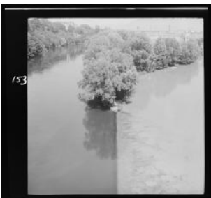
Genève, la jonction du Rhône et de l'Arve Jacques Thévoz vers 1960