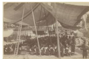
Genève, banquet dans le lit du Rhône Auteur inconnu 1884