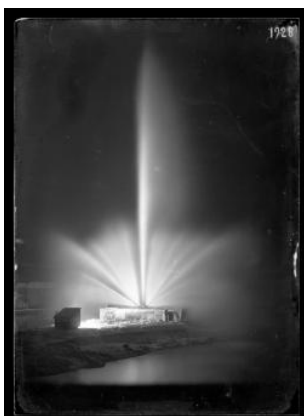
Genève, Coulouvrenière: jet d'eau 1886-1891