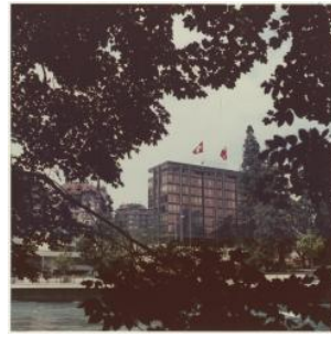
Genève, rue de Saint-Jean: immeuble des syndicats patronaux Jean-Jacques Lugin 1978