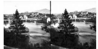
Genève, le Rhône à la Coulouvrenière Auteur inconnu 3e quart 19e s.; entre 1858 et 1872