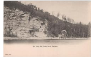
Genève, Saint-Jean: roue à aube au bord du Rhône 1902