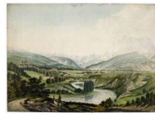
Genève, en aval de Vieux-Genève 1ère moitié 19e s.