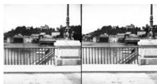
Genève, quartier de Saint-Jean Auteur inconnu entre 1860 et 1875