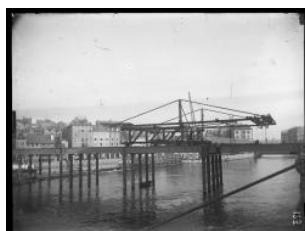
Genève, pont de la Coulouvrenière en chantier Auteur inconnu 4e quart 19e s.