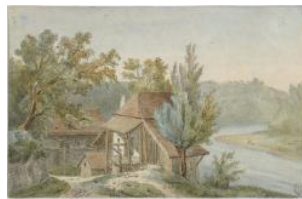
Onex, les Evaux; moulin Auteur inconnu Indéterminé