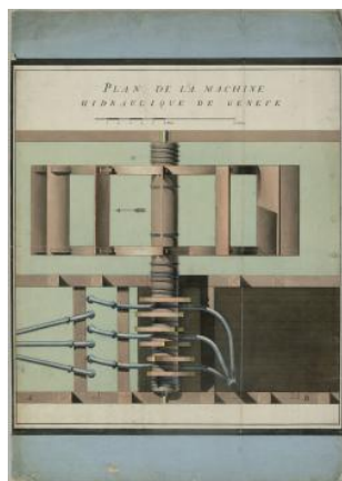
Genève, machine hydraulique: plan Auteur inconnu 1ère moitié 19e s.