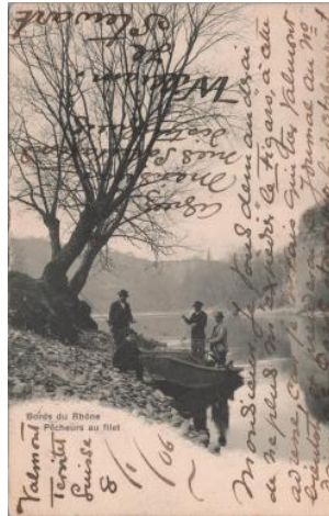
Genève, bords du Rhône: pêcheurs au filet Briquet & Fils