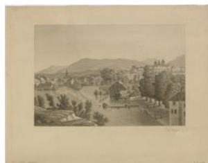
Genève, Coulouvrenière P. N. Faizan 19e s. (?)