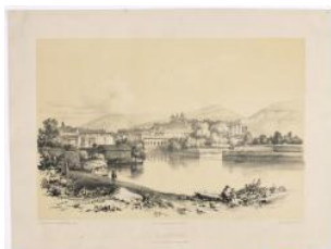
Genève, la ville vue du quai du Sujet actuel Veith et Hauser Frédéric François Dandiran 1838