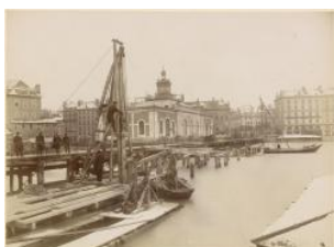
Genève, pont de la Machine: début du chantier des travaux du Rhône Auteur inconnu vers 1883