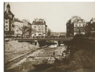
Rhône, travaux Charnaux Frères & Cie 1884