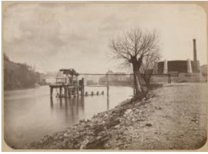
Genève, le Rhône: puiserande enlevée en 1881 avant 1882