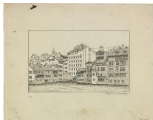
Genève, l'île vue du Seujet Auteur inconnu 19e s.; 20e s.