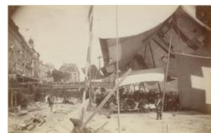
Genève, banquet dans le lit du Rhône Auteur inconnu 1884