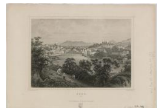
Genève, vue de Saint-Jean J. Poppel L. Rohbock 19e s.