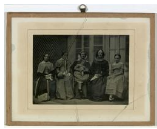
Groupe de femmes non identifiées avec un enfant à Paris Jean-Gabriel Eynard entre 1840 et 1845