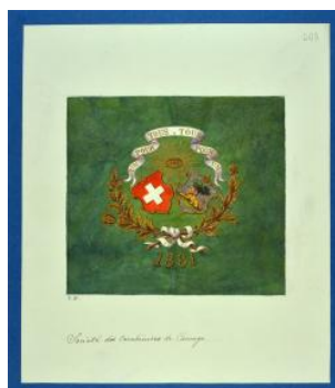
Drapeau genevois, Société des carabiniers de Carouge Louis George limite 19e s. 20e s.