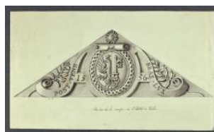
Genève, Hôtel de Ville