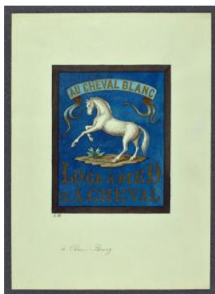
Chêne-Bourg, enseigne: hôtel du cheval blanc