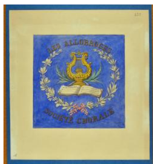
Les Allobroges société chorale Louis George limite 19e s. 20e s.