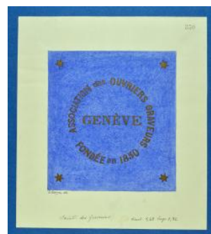
Drapeau genevois, Société des graveurs Louis George limite 19e s. 20e s.