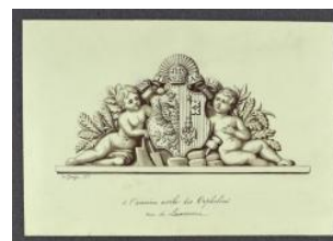
Genève, rue de Lausanne: asile des orphelins