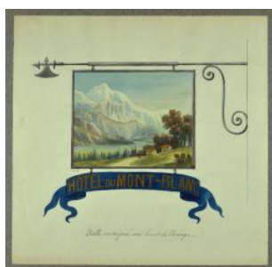
Genève, enseigne: hôtel du Mont-blanc