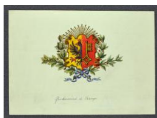
Carouge, gendarmerie (armoiries genevoises)