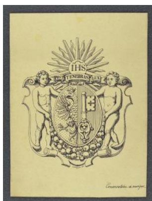
Genève, conservatoire de musique (armoiries)