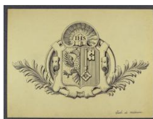
Genève, école de médecine