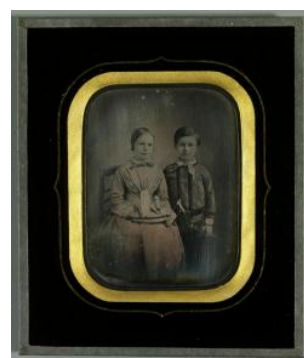
Fillette avec un bateau et garçon avec une épée

Jean-Gabriel Eynard Alexis Gaudin après 1846