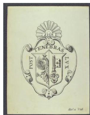
Genève, Hôtel de Ville