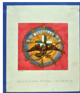
Drapeau du Noble Exercice du Jeu de l'Arc Louis George fin du XIXe siècle