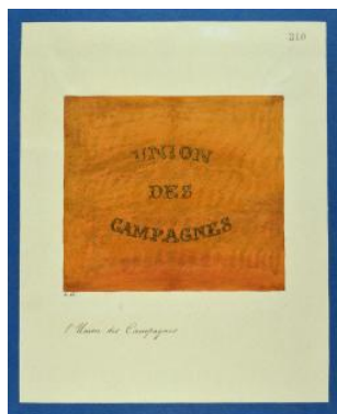
Drapeau genevois, Union des Campagnes Louis George limite 19e s. 20e s.