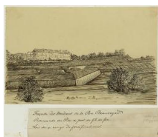
Genève, vue sur les façades des maisons de la rue Beauregard Louis George milieu 19e s.