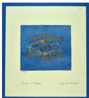
Drapeau genevois Louis George limite 19e s. 20e s.