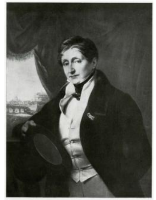
Portrait de Jean-Gabriel Eynard par Horace Vernet (Musée d'art et d'histoire de Genève) Horace Vernet avant 1963