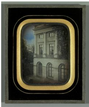
Le palais Eynard à Genève, façade nord-ouest Jean-Gabriel Eynard 16.04.1851