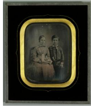
Fillette avec un bateau et garçon avec une épée Jean-Gabriel Eynard Alexis Gaudin après 1846