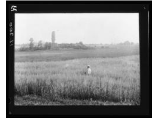
Meinier, Rouelbeau: les marais et les ruines du château (culture d'avoine)