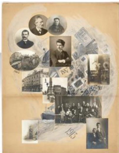
50e anniversaire de l'atelier Boissonnas