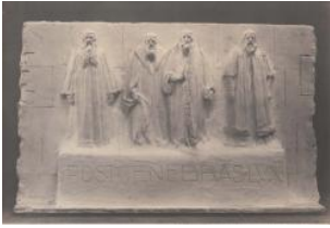
Genève, monument de la Réformation: projet "Le Mur", groupe central (no 52, 1er prix au concours, non retenu pour la sculpture)

Maurice Reymond de Broutelles Atelier Boissonnas 1908