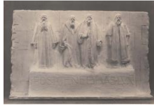
Genève, monument de la Réformation: projet "Le Mur", groupe central (no 52, 1er prix au concours, non retenu pour la sculpture)

Maurice Reymond de Broutelles Atelier Boissonnas 1908