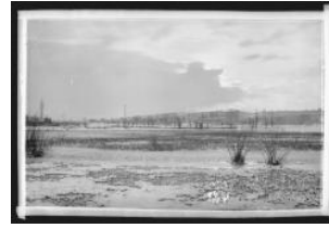
Meinier, Rouelbeau: ruines du château et marais Atelier Boissonnas 1896

Maurice Reymond de Broutelles Atelier Boissonnas 1908