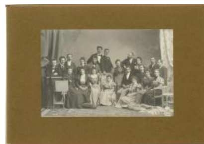
Les collaborateurs de l'atelier Boissonnas