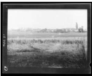
Meinier, Rouelbeau: les marais, les ruines du château, la Pallanerie