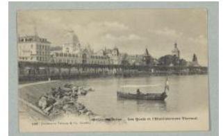
Haute-Savoie, Evian-les-Bains: quai Charnaux Frères & Cie avant 1906