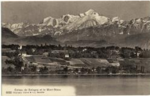
Cologny, le coteau et le Mont Blanc Charnaux Frères & Cie