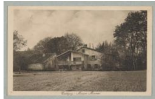
Cartigny, maison Monnier Charnaux Frères & Cie après 1910