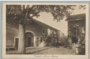
Cartigny, maison Monnier: la cour Charnaux Frères & Cie