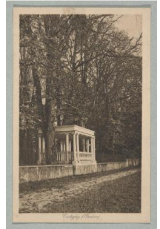
Cartigny: édicule de jardin Charnaux Frères & Cie