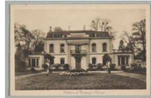
Cartigny, château Charnaux Frères & Cie