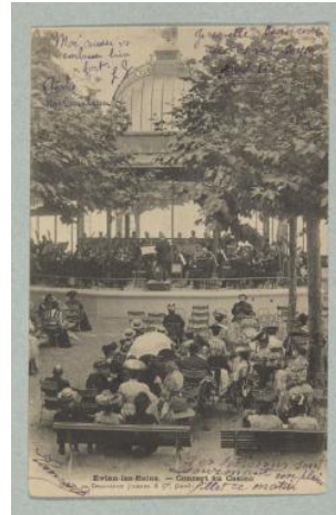
Haute-Savoie, Evian-les-Bains: casino (concert) Charnaux Frères & Cie