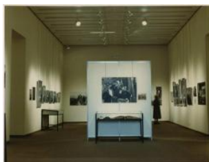
Genève, musée Rath: vue de l'exposition "Les Boissonnas, un siècle de photographie à Genève" (08.10.1981-29.11.1981)