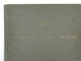
Album de voyage en Grèce de Fred Boissonnas: Athènes, Corfou, Zemenon Fred Boissonnas entre le 13.04 et le 06.06.1903