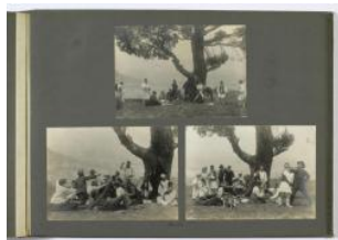
Grèce, Zemenon: le toast (ou le pique-nique)