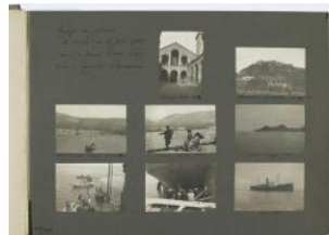
Grèce, départ en voyage