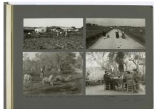
Grèce: arrivée à Corfou et course en voiture à Gastouri