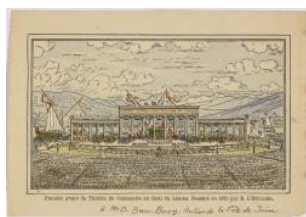
Genève, quai du Léman: projet de théâtre pour la fête du centenaire dédié par l'auteur à Daniel Baud-Bovy (1910) Eugène L'Huillier après 1910