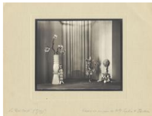
Zurich, roi cerf: marionnettes Daniel Baud-Bovy Sophie Taeuber-Arp Ernst Linck 1918