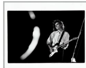
Eicher, Stephan: en concert à Dorigny (Lausanne)