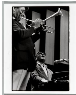
Dizzy Gillespie et Ray Charles: sur scène