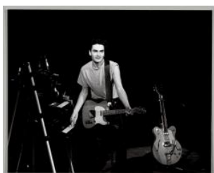
Eicher, Stephan: Printemps de Bourges