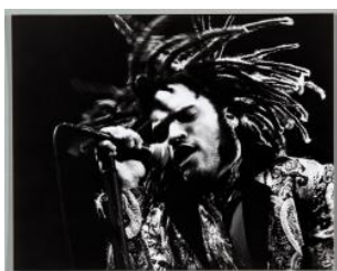
Kravitz, Lenny: Leysin Rock Festival Dany Gignoux 1990