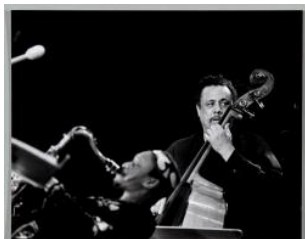
Mingus, Charlie (Charles): avec George Adams (Montreux Jazz Festival) Dany Gignoux