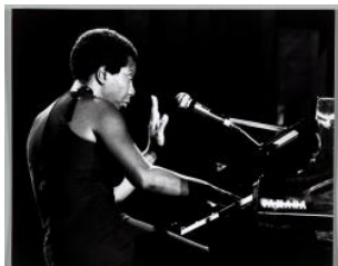
Simone, Nina: Montreux Jazz Festival