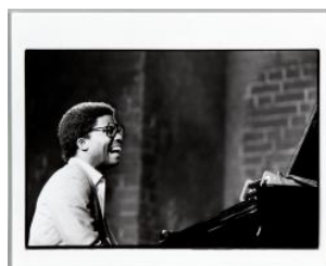
Hancock, Herbie: Montreux Jazz Festival 16.07.1981