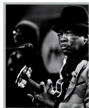
Hooker, John Lee: Montreux Jazz Festival 15.07.1983