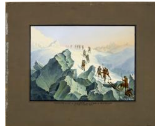
Haute-Savoie, descente de Monsieur De Saussure de la cime du Mont Blanc en 08.1785