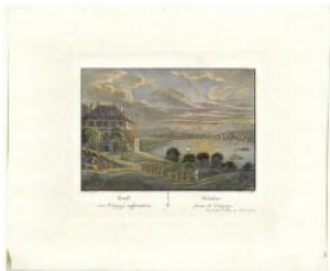
Genève, vue prise de Coligny