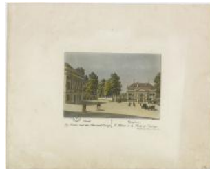
Genève, place de Neuve: théâtre des Bastions