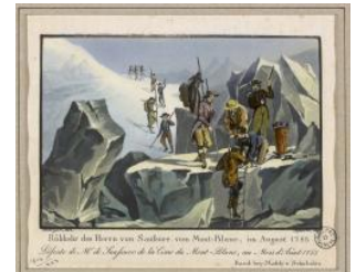
Descente de Monsieur de Saussure de la Cime du Mont Blanc, au mois d'août 1785