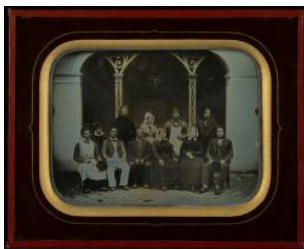
Des employés de Beaulieu devant la volière