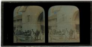
Les employés devant la ferme de Beaulieu avec des boeufs

Les œuvres où cette personne est représentée (10)